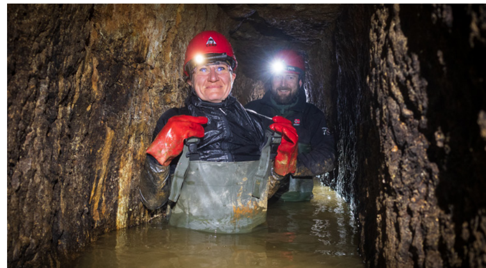
Píseční muzejníci při prohlídce štol sv. Josefa ve Vřescích.

Hospodařili jsme s příspěvkem od našeho zřizovatele Jihočeského kraje ve výši 28 160 000 korun, na vybraném vstupném jsme získali 706 tisíc, archeologové svou činností vydělali 651 tisíc,