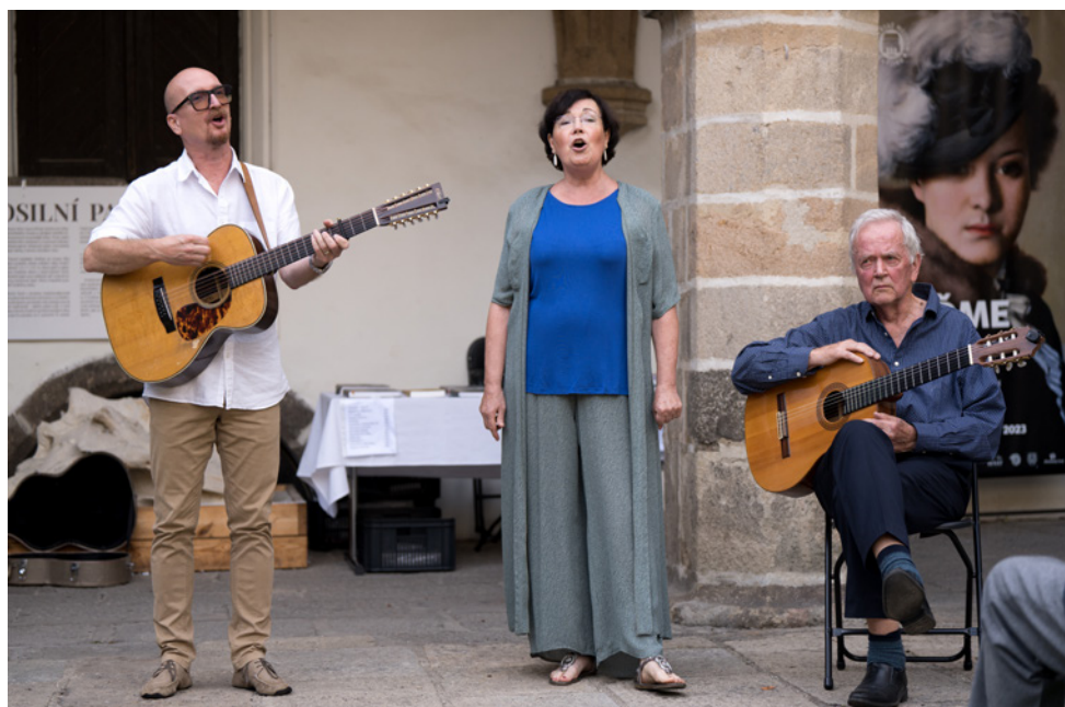
Členové bývalé hudební skupiny Spirituál kvintet obohatili vernisáž výstavy Pojďme mezi lidi .