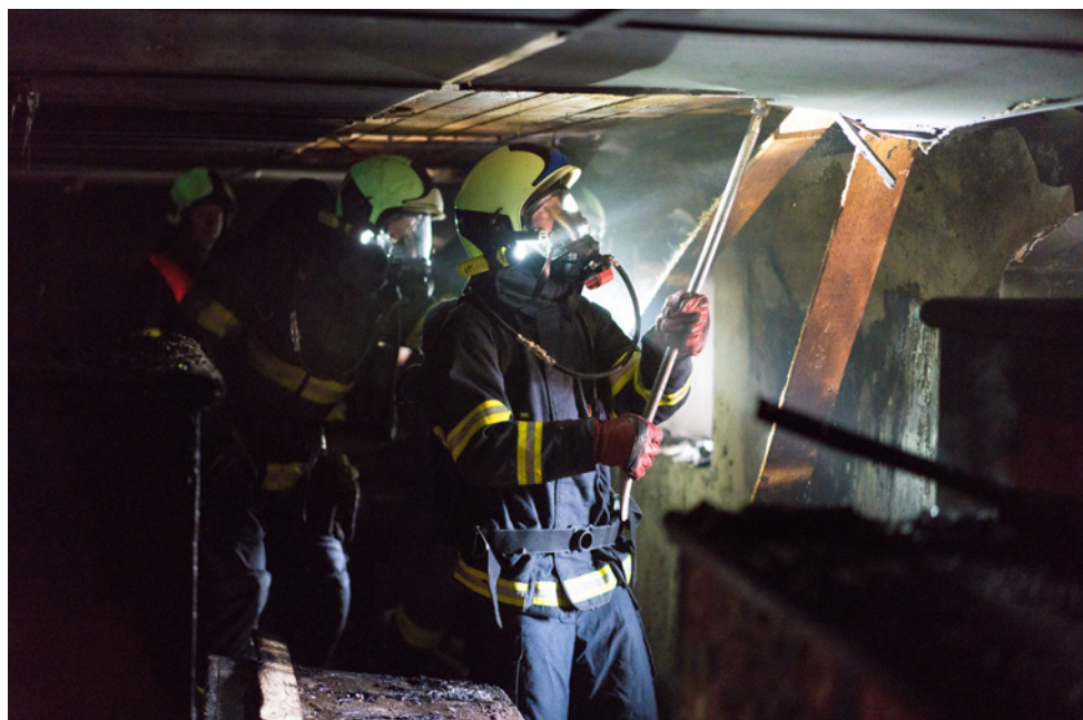
Hasiči při likvidaci požáru v depozitáři muzea.

sobily poprask: byl vysloven názor, že obsahují azbest, což by zcela změnilo situaci. Azbest je v současnosti považován za vysoce nebezpečnou látku a na manipulaci s ním je třeba dodržovat velmi speciální pracovní postupy. Naštěstí se po čase ukázalo, že se o azbest nejedná, a všichni si oddechli... Zásah měl ovšem dohru v řízení dotčených orgánů, přijela vyšetřovací skupina, která zjišťovala veškeré revize, jež ovšem shledala v pořádku. Expertízou se zjistilo, že příčinou vzniku požáru byla technická závada na elektroinstalaci zářivkového stropního svítidla umístěného na obvodové stěně v prostoru depozitáře. Cizí zavinění či nedbalost byly vyloučeny. V souvislosti s požárem v depozitáři etnografie jsme museli část předmětů vystěhovat. K tomu účelu jsme si pronajali další objekt v bývalém muničním skladu u Vráže. Na opravu stropu byl zpracován projekt a v roce 2024 dojde k rekonstrukci celého prostoru.