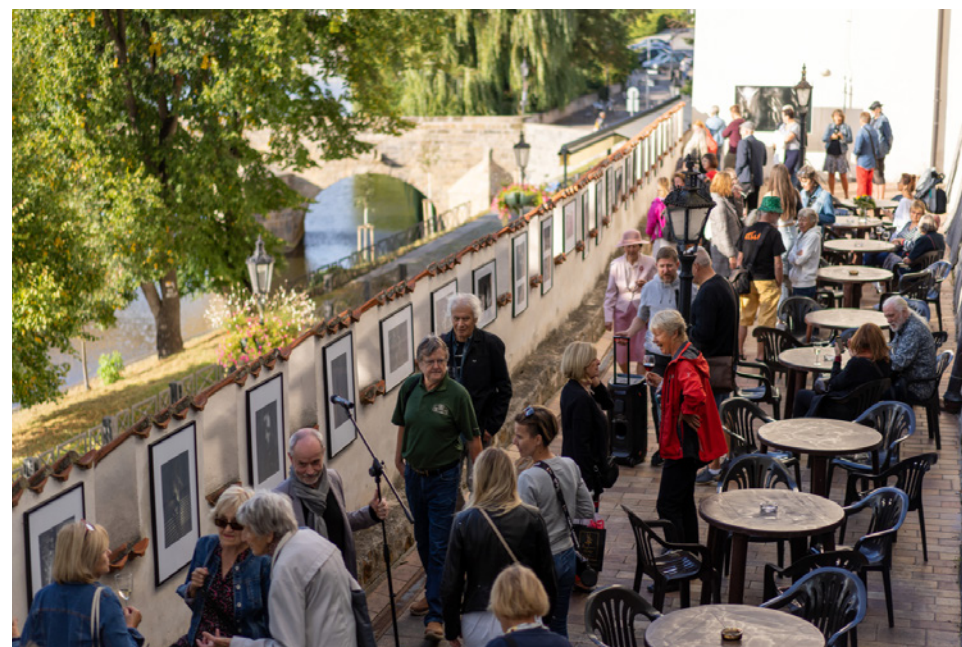
Z Výstavy jednoho dne na parkánech muzea.