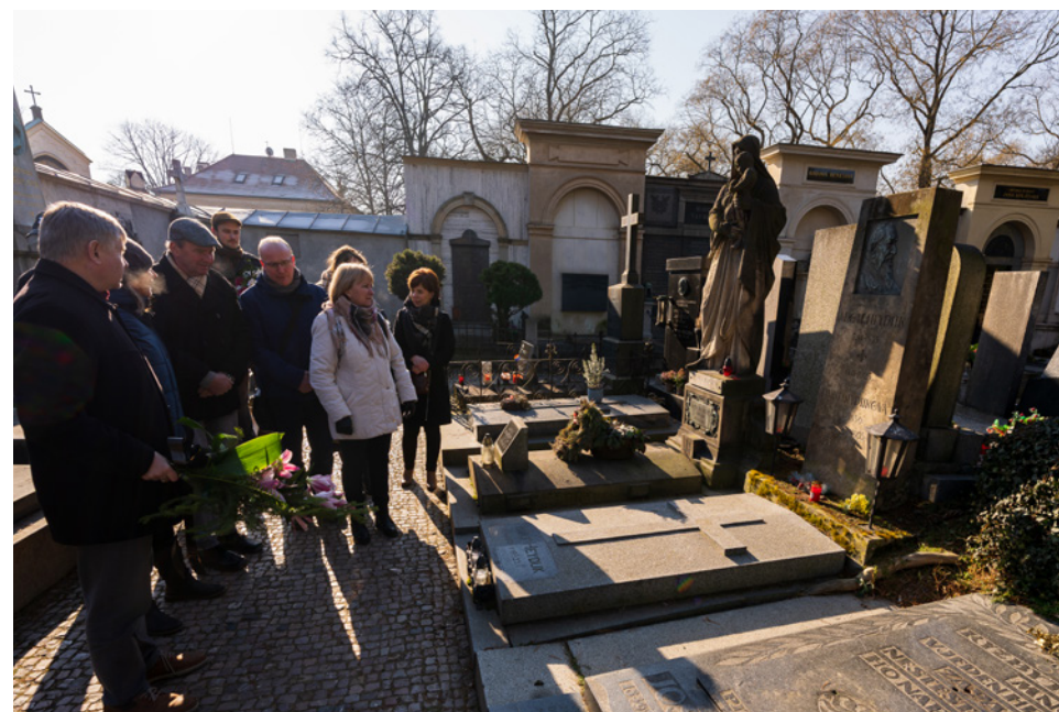
Pietního aktu u hrobu Adolfa Heyduka se zúčastnili zástupci píseckého muzea i básníkova rodiště obce Předhradí.