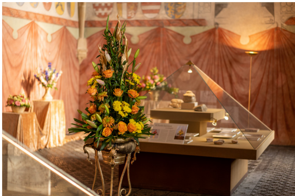
Květinová muzejní noc.

Květomluva – květiny ve výtvarném umění. Na ni navázala i Květinová muzejní noc . Uskutečnila se v pátek 26. května od 19 hodin a kromě několika komentovaných prohlídek výše zmíněných výstav byla hlavním motivem historická aranžmá květin v Rytířském sále, které pro nás připravil odborník na tuto problematiku, Slávek Rabušic. A tak mohli návštěvníci vidět, jak se živé květiny aranžovaly v gotice, v renesanci, v rokoku, v klasicismu, v empíru, či v secesním období. Nechyběly kreativní dílny pro děti, malování svíček, kování růže, výroba skleněných květů či květinové tisky na textil. O folkovou hudbu se postarala skupina Florecitas a na spodním nádvoří byl tradiční zájem o muzejní hospůdku.