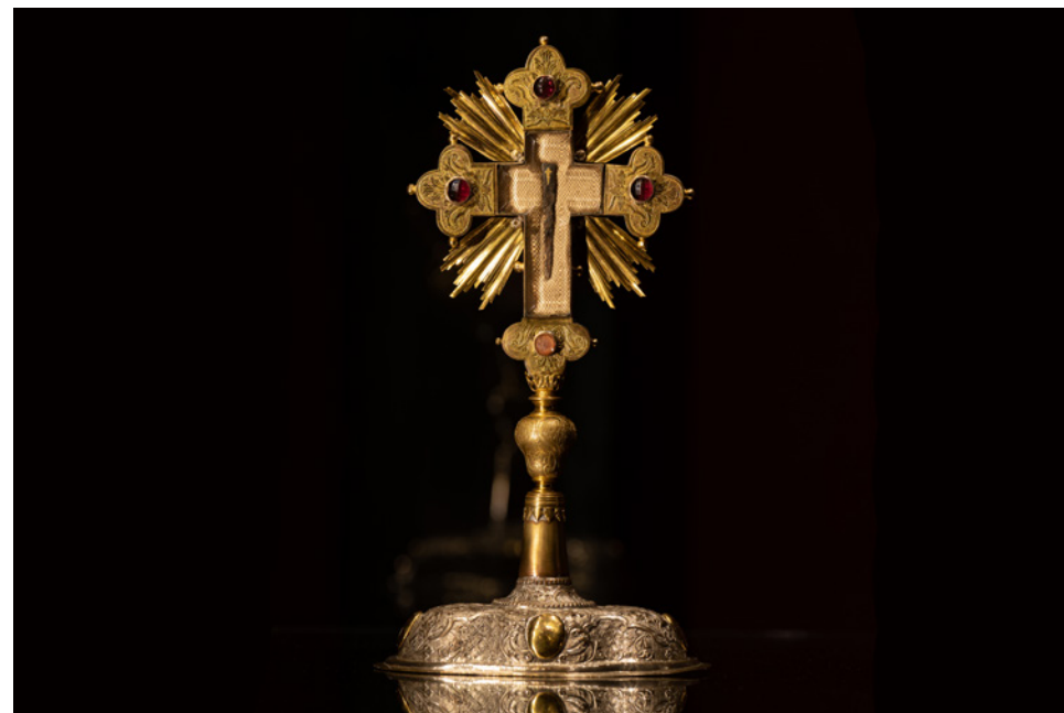
Svatý hřeb z Milevska v adjustaci pro píseckou výstavu.