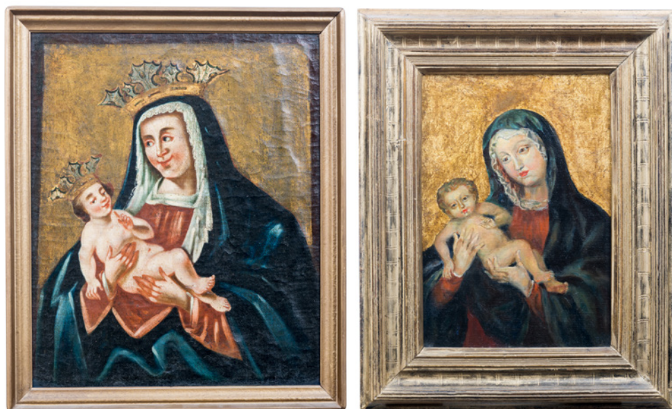
Vlevo: autor neznámý, Písecká Madona (kopie), olej na plátně, lepeno na dřevěné desce, 37,5 × 26,5 cm. V podobě s korunkami na hlavách, snad vytvořeno na sklonku 19. století, v nepůvodním rámu.