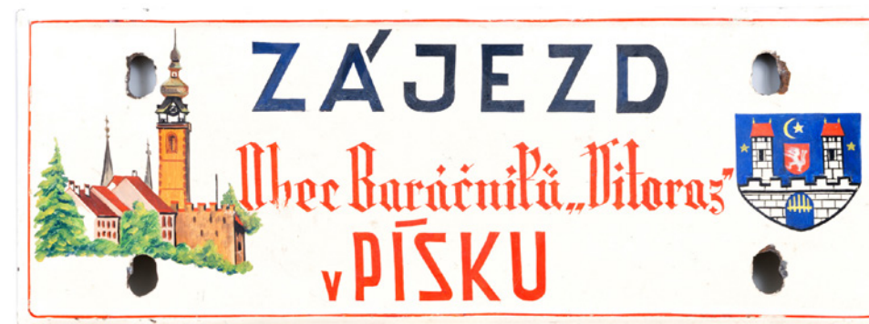
Cedule používaná při autobusových zájezdech OB Písek, HE08490