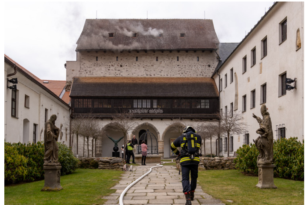
Pondělí 6. března 2023 13:40.

Máme za sebou rok 2023, rok, který pro naše zařízení málem znamenal katastrofu obrovských rozměrů, ale nakonec všechno poměrně dobře dopadlo. Zkrátka, v pondělí 6. března, nedlouho po 13. hodině, vypukl požár v depozitáři v dochovaném západním křídle hradu, přímo nad rytířským sálem. Ředitel s etnografem se v tomto depozitáři krátce před tím nacházeli, zhasli, zamkli a přesunuli se pracovat do jiných depozitářů v podkroví. Vtom přišla informace, že signalizace hlásí požár v tomto prostoru. Protože nikde nic viditelného nebylo, sdělili službě, že se jedná o falešný poplach a šli do pokladny zjistit víc. Do toho přicházejí informace o aktivaci dalších hlásičů a ředitel běžel nahoru znovu zjistit situaci. Tam už bylo cítit kouř a hasiči, kteří na nic nečekali, již natahovali z cisteren na náměstí hadice. Vše se odehrálo v několika minutách. Hasiči požár poměrně rychle lokalizovali, použili prostředky citlivé k uloženým předmětům i k památkově chráněnému objektu. V depozitáři byl uložen historický nábytek a další předměty, převážně rozměrnější, z podsbírky etnografické. Naštěstí zcela shořely jen dva sbírkové předměty, několik truhel bylo více či méně poškozeno, ale prakticky veškeré uložené předměty se nacházely pod vrstvou mastných sazí. Hasiči při zásahu také prosekali strop, což byl záklop mezi trámy – latě pobité zesponu deskami. Právě tyto desky později způ-