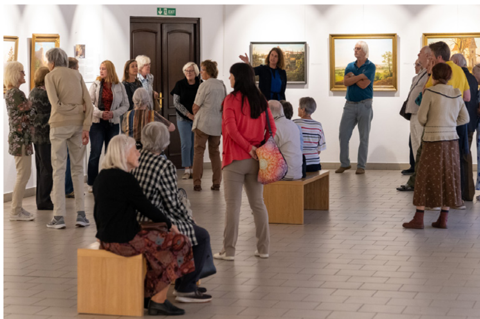
Komentovaná prohlídka výstavy Skálové .